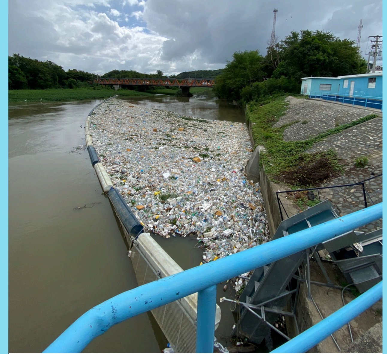
FOTO: RESIDUOS INTERCEPTADOS POR LA BARRERA TRAS 1 DÍA DE LLUVIA